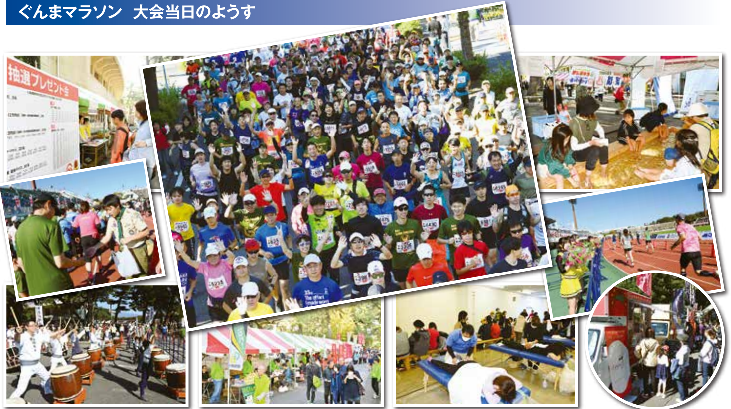
※写真は昨年の実績です